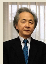
三浦 雅士 (文芸評論家)